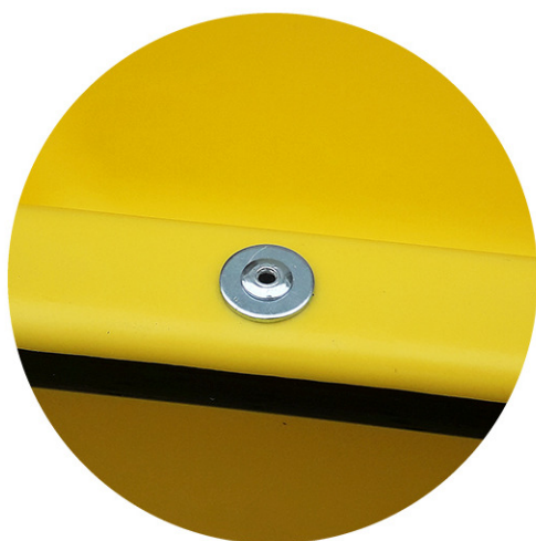
mocowanie na nierdzewne nity