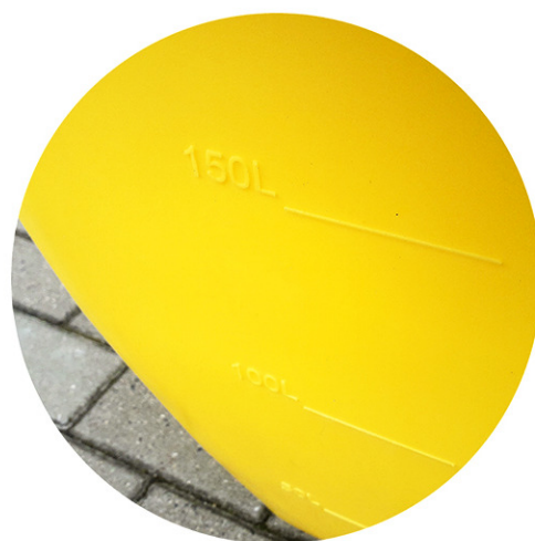
oznaczenia skali pojemności