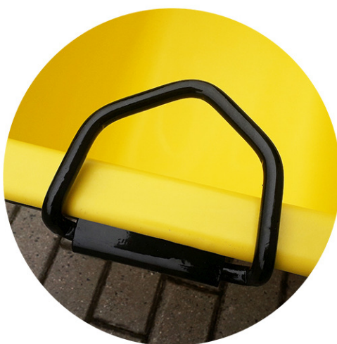
solidne uchwyty do podnoszenia